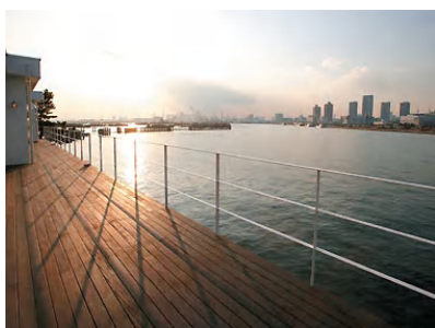
デッキからの眺めは最高ですよ。

日程： 2010年11月13日（土） 入場開始時間： 16：30（パーティー開始は17：00） 17：00までに必ずお越しください。 終了時間： 19：30 開催場所： 『Bayside』 http://www.studio-pia.com/studio/31/index.html 新木場駅 徒歩10分